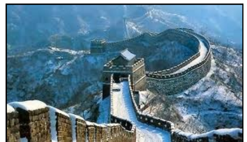
Muraille de Chine, un édifice de 6000 Km