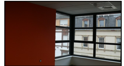
Intérieur du bâtiment