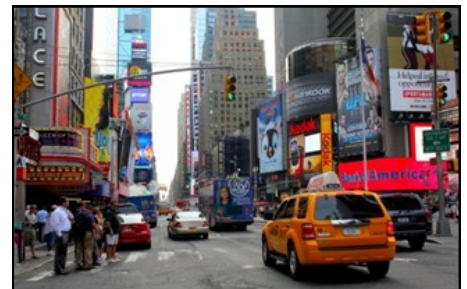
Visite de la région Canadienne et de New-York

« C'est LA plus belle décision que j'ai prise dans ma vie! »