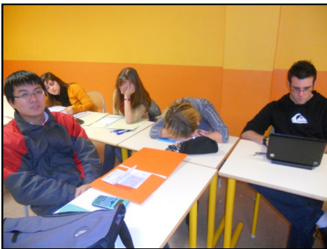
Quelques étudiants endormis par les cours

Selon l'avis des professionnels de l'éducation nationale et de la santé, cette contagion peut être stoppée par une écoute attentive des cours (et des blagues de Mr Letullier)