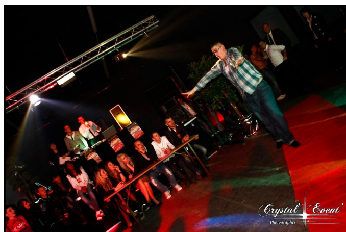
Élection de Miss et Mister VIP

Une élection de Miss et Mister VIP a même été organisée, les inscriptions étant libres, chacun avait donc sa chance de pouvoir passer devant un jury de 6 personnes et de gagner ainsi les lots prévus pour les vainqueurs: bouquet de fleurs, champagne, bons pour divers soins... Et pour ne pas faire de « jaloux », de nombreux lots ont été distribués au cours de la soirée.