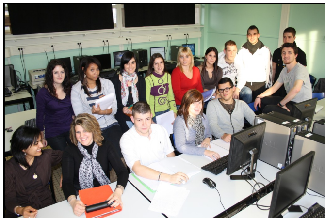
« Le cru » 2011/2012 vu par Jean-Marc Letullier

Une formation a ouvert à la rentrée 2011, en collaboration avec l'IUT de Metz et le lycée Poncelet de Saint-Avold. Le cru 2011/2012 est composé de 15 étudiants en soif de challenge et de découverte du monde actif qui les entoure.