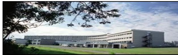
Cégep de Matane, au Québec